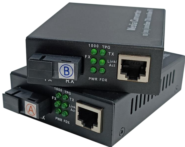
Convertor de Medios (lado A)